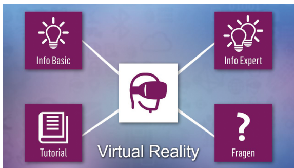
Infostuktur an den Technologiestationen