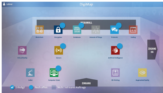
Digi-Map auf dem Tablet