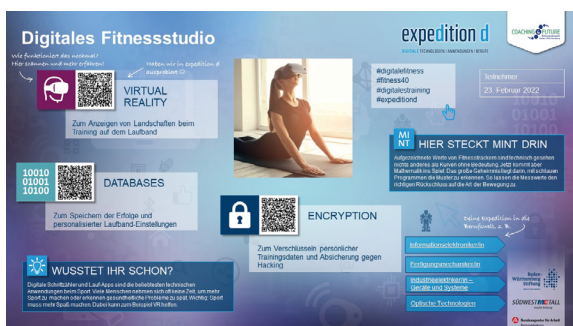
Digi-Poster auf dem Tablet